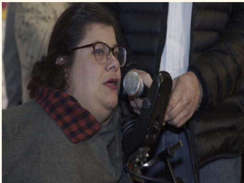
Emis Calderón Iniciativa: Fundación Arteboca